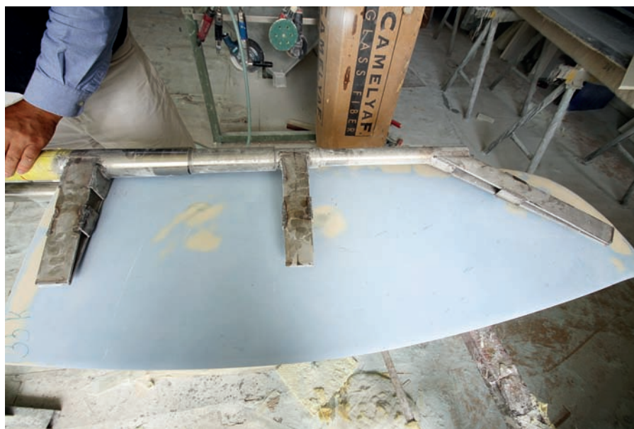
Kormidelní list obsahuje nerezovou tyč se třemi podélnými prsty jako výztuhou. Když s kormidlem narazíte, spodní třetina upadne, ale se zbytkem se dá doplout do mariny.