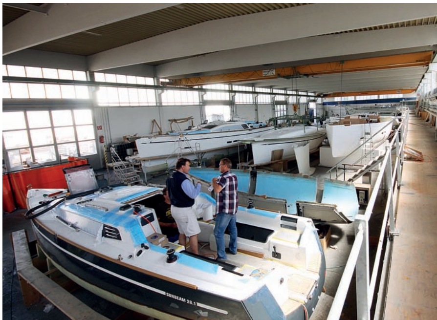
Montážní hala není obrovská, ale s dostatečnou kapacitou, lodě stojí na místě, u stropu se pohybuje jeřáb, který manipuluje s jednotlivými díly.