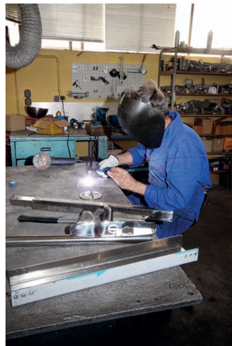
Nerezové kování se většinou vyrábí přímo v loděnici Sunbeam. Je to krásná ruční práce. Výhodou je hlavně možnost zhotovit zákazníkovi speciální nerezové části podle jeho přání.

polyester, který není tak agresivní a nebezpečný jako epoxid pro zaměstnance, je také levnější. Polyester je sice těžší, ale to u turistických lodí až tak nevádí. Stejně se přidává hodně balastu. Lodě jsou daleko stabilnější, lépe se chovají na vlnách. Polyester lépe izoluje ve spojení se sendvičovou palubou vyrobenou ze dvou vylaminovaných a následně slepených dílů. Hluk od motoru nebo dešťových kapek je proto v kajutě výrazně nižší. Dbáme také na bezpečnost. Například kormidelní list obsahuje nerezovou tyč se třemi po-