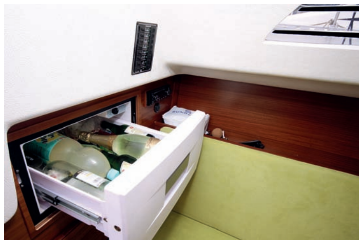
Plavbu nám zpríjemní zabudovaný kávovar, bar se skleničkami a láhvemi dobrého pití, vyšupovací lednička plná osvěžujících nápojů.