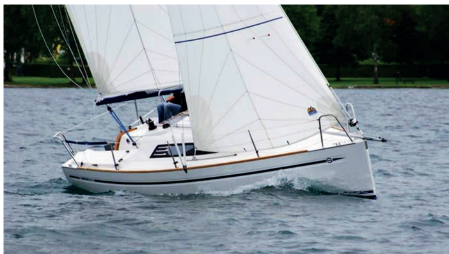
Sunbeam 24.2 se chová dobře i v silnějším větru.

zákazníkem zvolená barevná kombinace – čalounění mahagonového interiéru je hráškově zelené, doplňky včetně genakru fialové. Postrádám kuchyni. „Design jezerních plachetnic jsme zásadně přepracovali. Dříve si lidé i na malých lodích vařili sami, kuchyň byla důležitá. Teď ji nepotřebují, stravují se převážně v restauracích, kterých je tu kolem dostatek,“ vysvětluje Gerhard. „Když ji bude zákazník chtít, může si ji objednat,“ dodává. Kajuta je jinak překvapivě prostorná s výškou 1,55 m, jsou zde čtyři lůžka, přední je dlouhé 2,2 m a v nejširším místě 1,9 m široké. A dvě zadní jsou dlouhá 2 m a široká 65 cm v nejširším místě. Když se odklopí polštáře, objeví se otáčecí stůl o rozměrech 70 x 60 cm. Pod předním