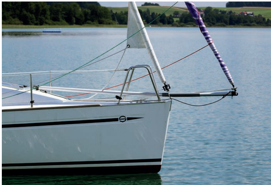
Šikovné je použití spinakrového pně zároveň jako čelenu pro genakr. Genakr je navíc na rolfoku.

Takeláž se dvěma páry sálingů ovšem bez zadního stěhu dostala do vinku kosatku na rolfoku,