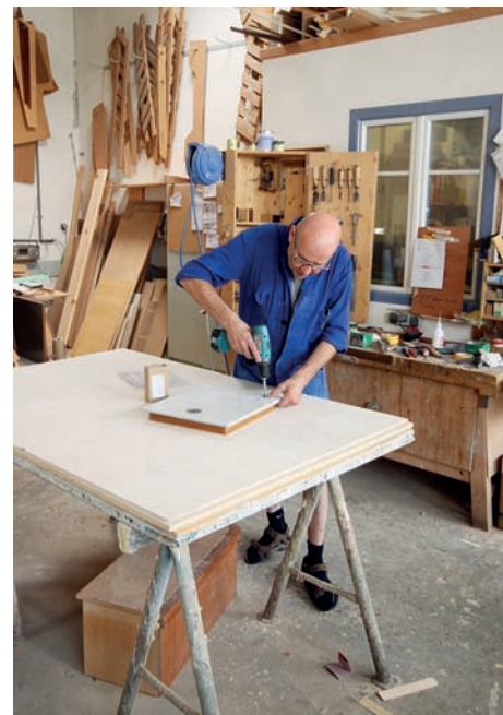
Procházíme i truhlářskou dílnou.

bylo holé dřevo. Garantují 100% odolnost proti vodě. Montážní hala není obrovská, ale s dostatečnou kapacitou, lodě stojí na místě, u stropu se pohybuje jeřáb, který manipuluje s jednotlivými díly. Na závěr nechybí testovací bazén. Nový model Sunbeam 40.1 se zde právě dotváří. Nahlížím do interiéru a se zájmem sleduji diskuzi o rozmístění vybavení v kuchyni. Debatují o tom tři muži – Manfred, designér a technik. Přidávám svůj praktický ženský pohled a jsem zvědavá na výsledek. Ten ale uvidím až na podzim, kdy bude nová „čtyřicítka“ dokončena. Jednou z možností bude „The open house show“ v loděnici Sunbeam, která se bude konat 28.–30. listopadu. Při této příležitosti budou prezentovány