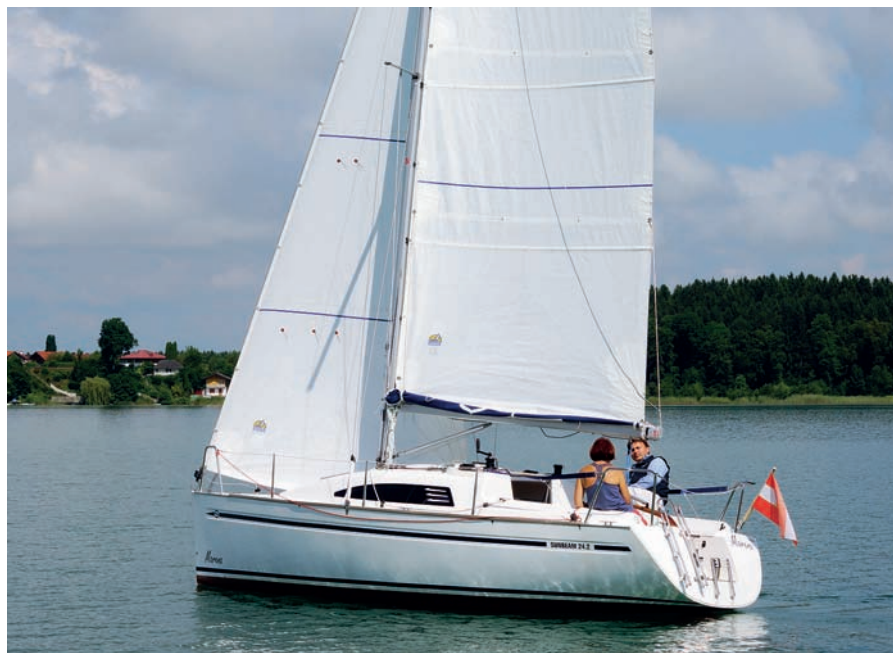
Během našeho testu vál jen slabý vítr.