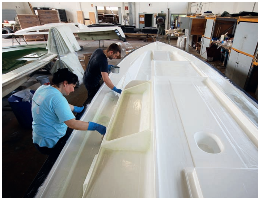
Lodě se laminují výhradně ručně a pouze z polyesteru.