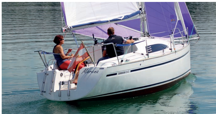
Ovládání genakru je velmi snadné.

lůžkem je velký úložný prostor, kam jde nainstalovat chemický záchod. Plavbu nám příjemní zabudovaný kávovar, bar se skleničkami a láhvemi dobrého pití, vyšupovací lednička plná osvěžujících nápojů. O světlo a odvětrání kajuty se starají otevírací lukna nad předním lůžkem před stěžněm a boční okénka po celé délce salonu.