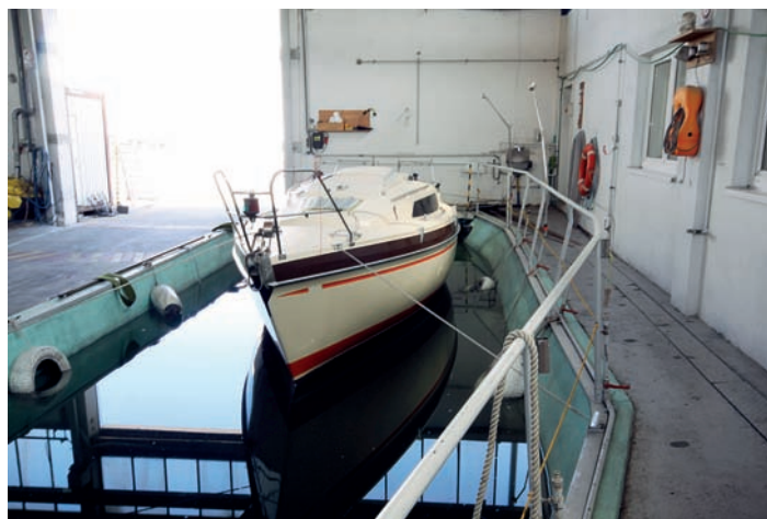
Na závěr nechybí testovací bazén.