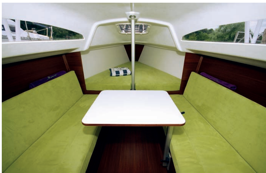
Při vstupu na palubu mě zaujme barevná kombinace – čalounění interiéru je hráškově zelené, doplňky včetně genakru fialové.

celospírovou hlavní plachtu s širokou horní částí (roachem) s lazy jackem, spinakr i genakr, vše značky Doyle-Raudaschl. Ovládání výtahů je svedeno do kokpitu ke dvěma vinšným, osmi stoperům a čtyřem klemám na nástavbě. Jednoduchý kladkostroj otěže hlavní plachty je uchycen uprostřed kokpitu. Když se nepoužívá, je možné jej připnout na bok lodi, aby v kokpitu nic nepřekáželo. Šikovné je použití spinakrového pně zároveň jako čelenu pro genakr. To se hodí při závodech, když trasa vede na zadní vítr, pluje se se spinakrem a peň se ukládá do ok na ráhne jako třeba na Fireballu, na boční vítr lze vytáhnout jednoduše genakr a peň je upevněn na přídi, kde plní funkci čelenu. Genakr je navíc na rolfoku, jeho ovládání je tak velmi jednoduché, při halze jej lze pře-