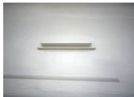
Všechny otvory se nevyřezávají, ale laminují. Například okna jsou vylaminována ve třech úrovních, před osazením rámem se uřízne svrchní část.

délnými prsty jako výztuhou. Když s kormidlem narazíte, spodní třetina upadne, ale se zbytkem se dá doplout do mariny.“