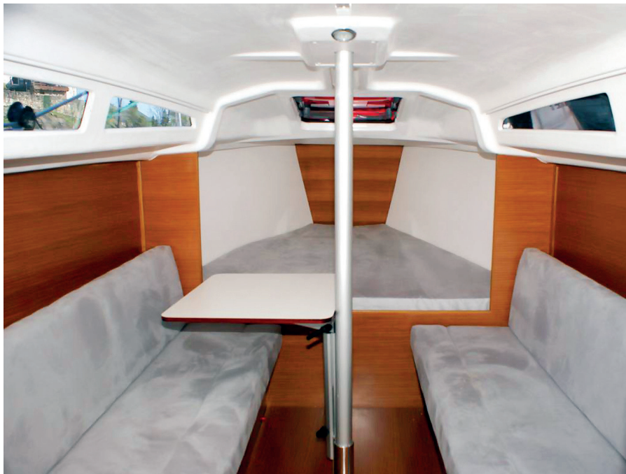
Lůžko v přídi není oddělené od salonu, je 2,1 m dlouhé a zaručuje klidný spánek. Další dvě pohodlná lůžka lze získat rozložením sedaček v salonu.

toru i při slabém větru. Takeláži chybí zadní stěh, což umožňuje použití nadstandardně velké hlavní plachty. Manipulaci s plachtami usnadňují nejen vinšny, umístěné na střeše nástavby, ale i samopřehazovací kosatka a nový systém rolování genakru. Zajímavou inovací je neobvyklý kýl, který zajišťuje větší stabilitu, kontrolu nad lodí a rychlost. Tvarem a připojením vřetena trochu připomíná Pinocchia, vypadá trochu legračně, ale funguje perfektně. Motor je v Sunbeamu 28.1 zabudovaný, můžete si vybrat buď diesel Volvo Penta, nebo elektromotor.