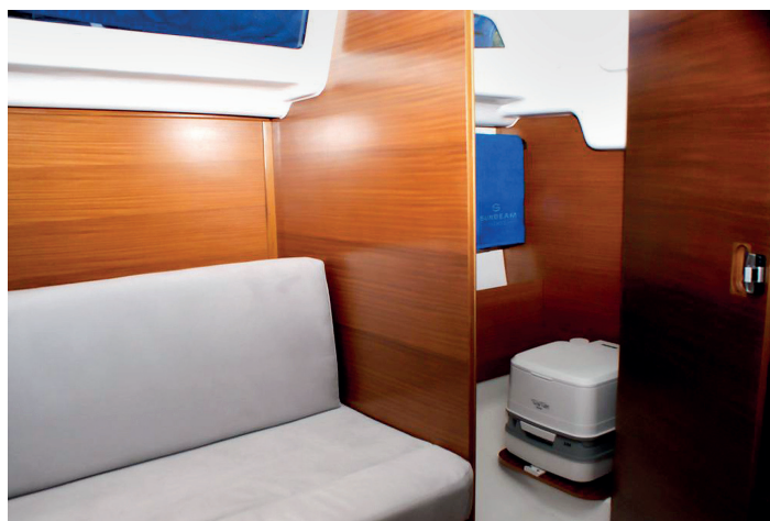
Na lodi může být jak chemické, tak pumpovací WC.