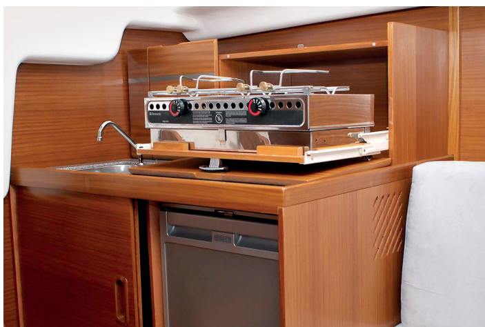
Kuchyně zabudovaná na levoboku nabízí vše, co pro pobyt na lodi potřebujete.